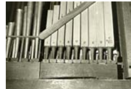
Abb. 6e Register Fagott und Trompete