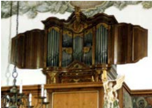
Abb. F Fuggerei / Augsburg