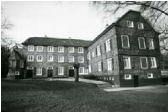
Abb. 1 Teschemacherhof; erbaut 1640; heutiger Zustand In der Mirke; Wuppertal-Elberfeld