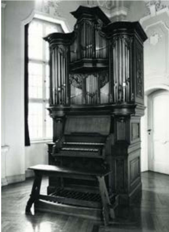
Abb. 2 Orgel 1746; Lukas-Kirche, Wuppertal-Elberfeld

Besteller der Orgel, deren zweigeschossiger Prospekt eine Besonderheit darstellt, bisher unbekannt 85 . Im 19. Jahrhundert der Legende nach im Besitz der Barmer Baptistengemeinde 86 , wurde das Instrument 1906 von dem Elberfelder Architekten Hüttemeister auf einem Dachboden wiederentdeckt. Aufstellung in dessen Haus durch Faust (Barmen, später Schwelm) unter Einrichtung pneumatisch gesteuerter Kegelladen für 4 Register, neuer Manualklavatur (C–f 3 ) und eines von C–H selbständigen 16'-Transmissionspedals. – Bei Erwerb der Orgel durch die Lutherische Kirche Elberfeld 1936: weiterer Umbau von der gleichen Firma durch Hinzufügung eines 2. Manuals mit 3 Registern. – Im Jahre 1975 Abschluss der Rekonstruktionsarbeiten, nach Plänen von Hulverscheidt ausgeführt durch Opitz, Witten (Orgelbau) und Metze, Wuppertal (Holzarbeiten): Bis auf die originalen 45 Prospekt Pfeifen (Prinzipal 4', Octava 2') und 21 Holzpfeifen (Fleut travers 4') entstand in dem ursprünglichen Gehäuse – nur der Manualkasten von Faust wurde beibehalten – eine neue Orgel nach erhaltenen Teschemacher-Vorbildern. Umfang des bei g / gis geteilten Manuals wieder C–c 3 unter Neuhinzufügung von Cis; auch ein ehemals nicht vorhandenes angehängtes Pedal (C–d 1 ) wurde aus praktischen Gründen ergänzt.