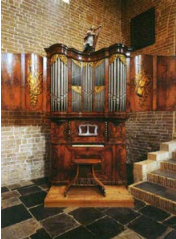
Abb. A Michaelskerk, Oosterland / NL

Im Jahre 1994 Umsetzung der Orgel von der Empore in den Chorraum der Kirche durch A. de Graaf / Leusden /NL, der auch das Instrument 1974 restauriert hatte. Neben kleineren Reparaturen an den Pfeifen dabei Anlage einer neuen Windversorgung: Das elektrische Gebläse steht jetzt unter dem Chorraum in der Krypta, der Magazinbalg wurde in die Orgel verlegt n.2 . Das Orgelgehäuse restaurierte Jan Berghuis / Voorschoten (bei Den Haag) / NL.