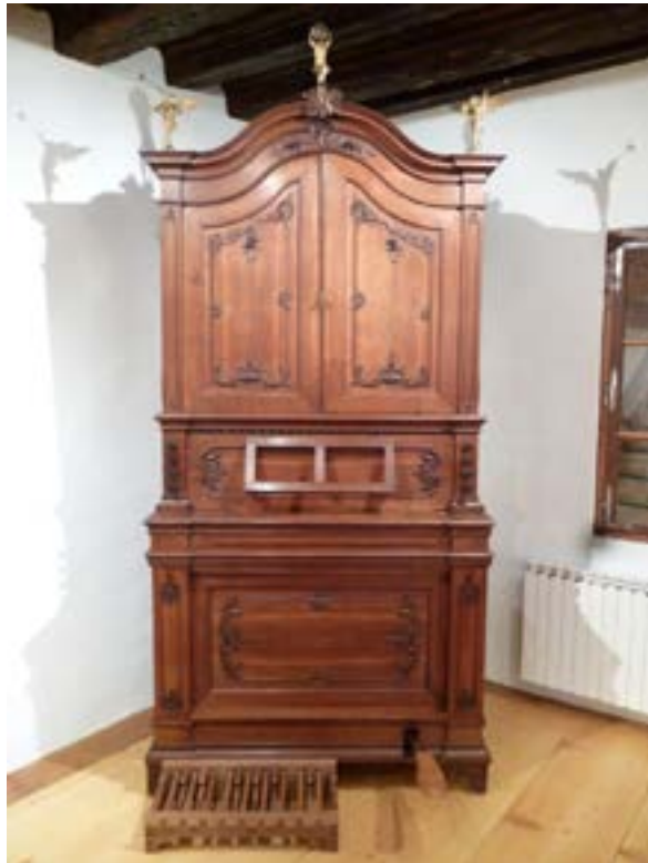
Abb D Schweizer Privatbesitz - Nachf. Patrick Montan-Missirlian