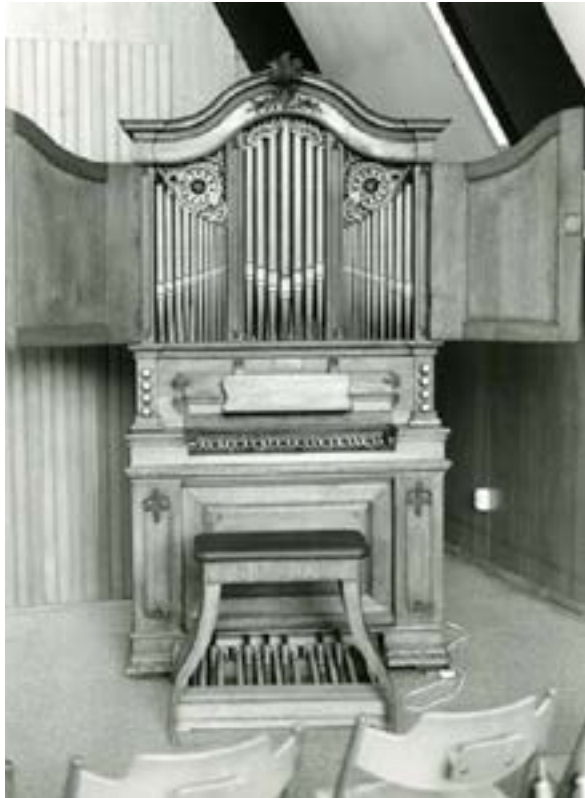
Abb. 7 Philippuskirche – Wuppertal-Elberfeld