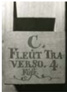
Abb. 6b Registerbeschriftung

Weitere Besonderheiten: Tremulant; Ladenmaße nur 50 x 180, daher sehr kompakte Bauweise; Vox humana 8' Disk, unterhalb der Windlade platziert. Verschließbare Luke in der Decke zur zusätzlichen Beeinflussung der Lautstärke. Das in seiner Gehäuseform für Teschemacher recht untypische Instrument steht auf 4 Holzrollen. Gemälde auf den Prospektüren nicht original.