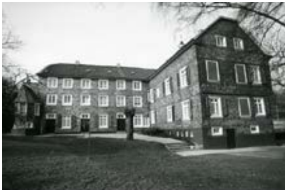
Abb. 1 Teschemacherhof; erbaut 1640; heutiger Zustand In der Mirke; Wuppertal-Elberfeld