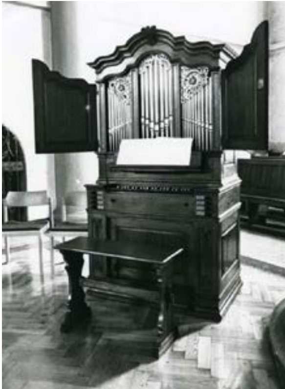
Abb. 4 Evangelische Kirche – Essen-Werden