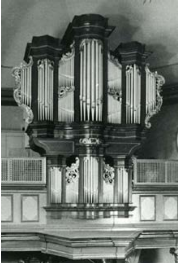
Abb. 9 Luth. Kirche Berger-Straße – Düsseldorf