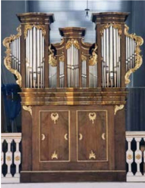
Abb. B St. Laurentius

Rekonstruktion unter Verwendung noch aller verfügbaren Materialien durch Gebr. Oberlinger / Windesheim und 1983 Aufstellung als Chororgel in St. Laurentius. Dabei Ergänzung um ein hintergestelltes Pedalwerk, das als völlig selbständige Einheit 4 Register umfasst. Zur Fertigstellung der Orgel schreibt Hulverscheidt n.3: