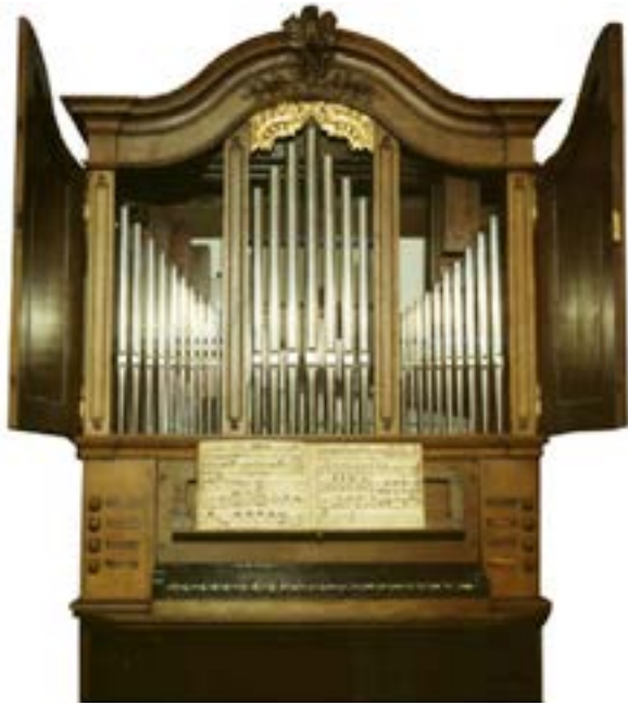
Abb. G Precker