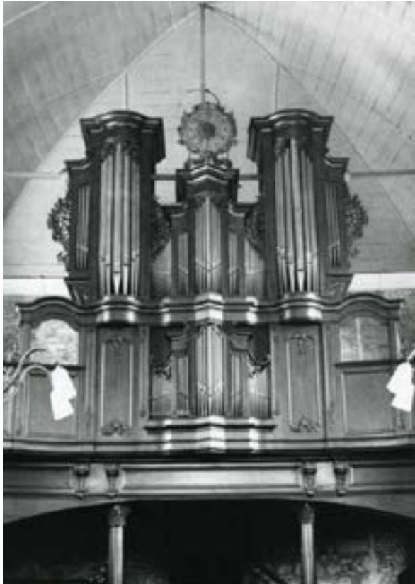
Abb. 10 Hervormde Kerk – Vaals