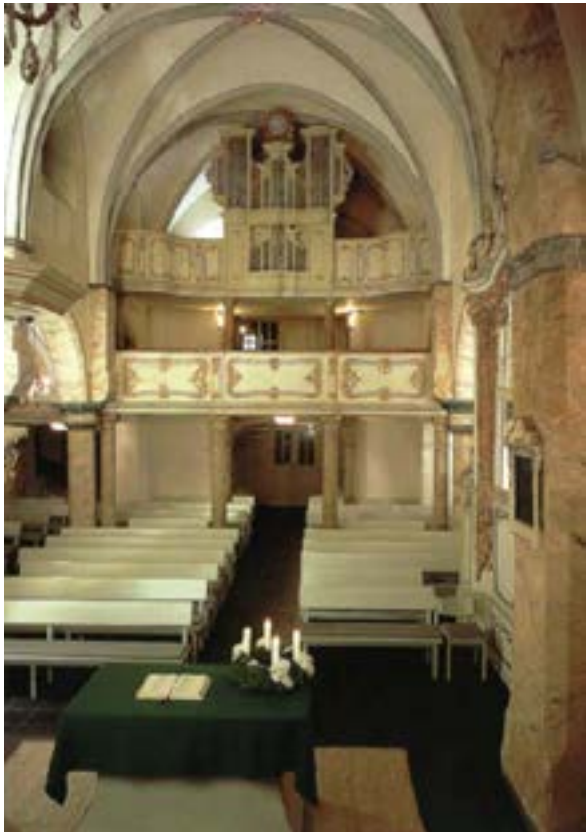
Abb. C Wickrathberg

Rekonstruktionsvorschlag als einmanualige Orgel gem. Teschemacher durch Klais / Bonn n.4 bleibt unberücksichtigt. Statt dessen Einbau eines zweimanualigen Werkes 1990 durch Lukas Fischer / Rommerskirchen mit Rückbau des verunstalteten Gehäuses in den ursprünglichen Zustand und Verwendung des originalen Teschemacher-Pfeifenbestandes im Prospekt: obere Felder Prinzipal 4', unten Blindpfeifen n.5 . Wenn somit auch im Inneren ein anderes Instrument, ist die Orgel äußerlich mit ihrem Prospekt eine der wenigen original erhaltenen Teschemacher-Kirchenorgeln. Sie läßt in ihrer raumbezogenen Schönheit einmal mehr erahnen, was allein in Bezug auf seine Werkstatt durch den 2. Weltkrieg in Düsseldorf / Bergerstraße und Wuppertal / Wupperfeld verloren gegangen ist.