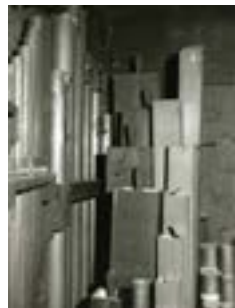
Abb. 6c Pfeifen innen - Stöpselgriffe