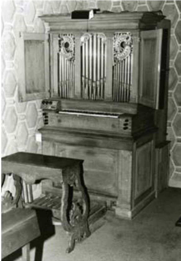
Abb. 5 Antoniuskrankenhaus – Gronau

Hinweise bei Reuter 96a auf eine Schrankorgel aus dem Nachlas eines früher in Gronau ansässigen niederländischen Mennoniten. Nachfolgende Beschreibung lässt Schlüsse auf unbekanntem Erbauer evtl. als Jacob Engelbert Teschemacher zu: