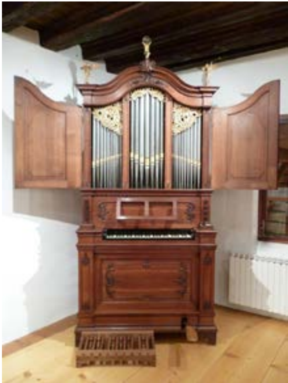
Abb. E Schweizer Privatbesitz - Nachf. Patrick Montan-Missirlian

der Original-Stimmung. Einen großen Teil nimmt die Beschreibung des Erhaltungszustandes und der Mensuren im Pfeifenbestand der einzelnen Register ein.