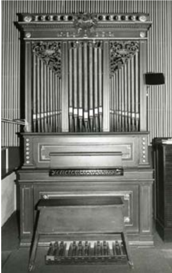
Abb. 8 Michaelskirche – Wuppertal-Elberfeld

Orgel nur noch teilweise – die Pfeifen zeigen seine Signaturen – von Teschemacher ausgeführt 124 . Fertigstellung vermutlich durch Gerhard Schrey 125 . Nach Hulverscheidt nur unerhebliche Abweichungen gegenüber Teschemachers Bau- und Dispositionsweise. Auffällig die sonst nur noch in Kirchrarbach vorkommende Zungenstimme 126 . Ursprünglicher Zustand weitgehend erhalten. Manualumfang C–f 3 Teilung bei h / c 1 . Angehängtes Pedal (C–g) ebenfalls original. Nach unsachgemäßer Reparatur 1948/49 127 erfolgte 1965 Restauration 128 durch Stahlhuth/Aachen 129 . Instrument stand bis 1967 im Kirchsaaal Roonstraße, wohin es 1895 aus der Schule am Thomashof versetzt worden war 130 . Weitere Vorgeschichte unbekannt.