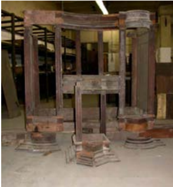
Abb. H Alexander Schnütgen / St. Cäcilia – Köln

Damit wäre zugleich die bisher als verschollen gegoltene, von Teschemacher in seinem Brief vom 21.11.1746 erwähnte Hausorgel mit unzuweckmäßiger Disposition und zu engen Mensuren, die in der Kirche „ hinlängliche Dienste tut “ (s.o. p.30), gefunden.