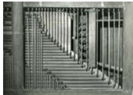
Abb. 6d Spielmechanik